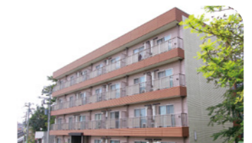
レジデントハウス

研修医もしくは6ヵ月以上継続して雇用される専攻医・シニアレジデントが対象のレジデントハウスがあります。空室状況により入居できない場合があります。ご希望の方はお問い合わせください。