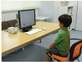
注視点計測による社会性発達評価