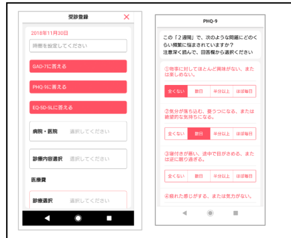
△質問項目回答画面

「うつ不安レコード」アプリ利用者の方には、毎回の通院の前後にデータを入力していただくという作業を、原則1年間続けていただくようお願いします。